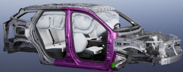
Air-Bag & Steel Frame

Sisteme avansate de asistenta pentru sofer: