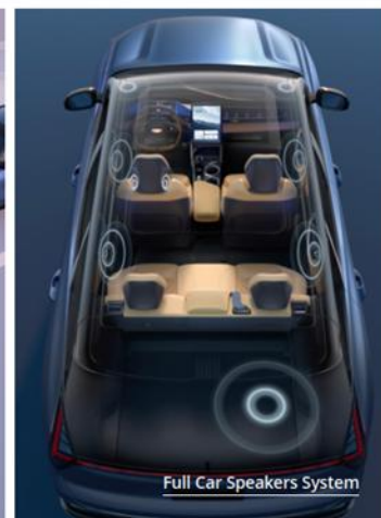
Full Car Speakers System