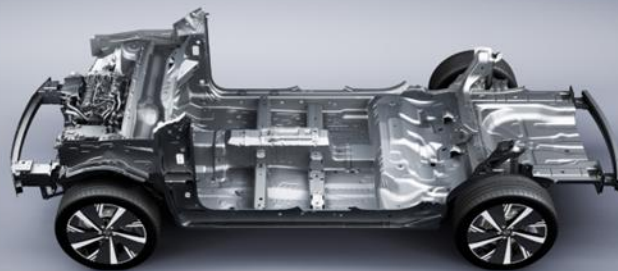
Comfortable Chassis Adjustment